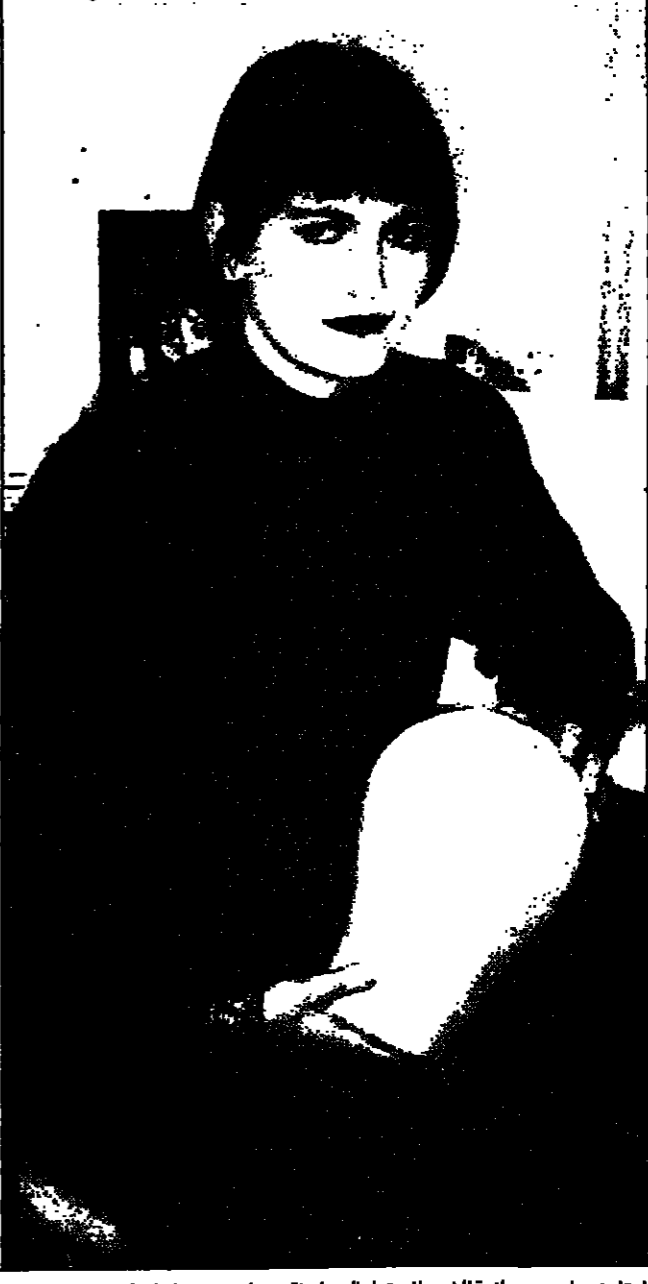
اوتاه نيوميل، من صانعة الشعر المستعار الى باحة في ترويج صنع الباروكات